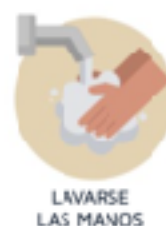
LAVARSE LAS MANOS