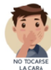
NO TOCARSE LA CARA