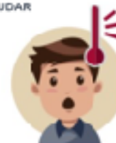
CONTROL DE LA TEMPERATURA